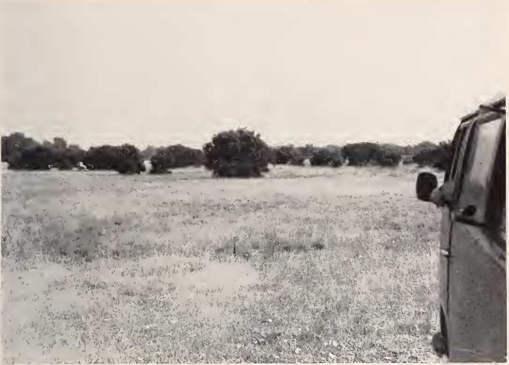
Abb. 5: Biotop, wie er von kükenführenden Hennen bevorzugt wird.